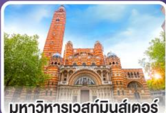
มหาวิทยาลัยเวสต์มินสเตอร์