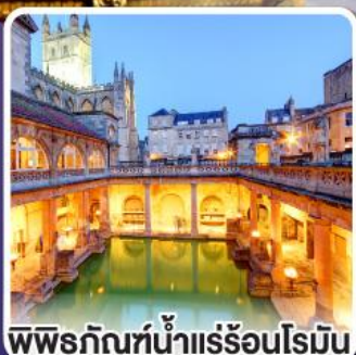
พิพิธภัณฑ์น้ำแร่ร้อนโรมัน

ตื่นตาตื่นใจ กับเสาหินสโตนเฮนจ์ 1 ใน 7 สิ่งมหัศจรรย์ของโลก