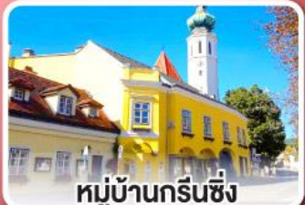
หมู่บ้านกรีนซิง