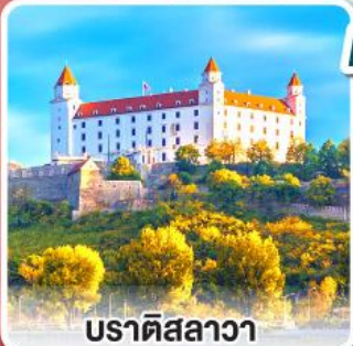
บราติสลาวา

เยือนหมู่บ้านกรีนซิง แห่งออสเตรีย พร้อมอาหารค่ำแบบ “ฮอยริเก้”และไวน์สด