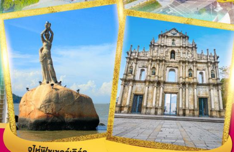
จูไห่พิซเซอร์รี่