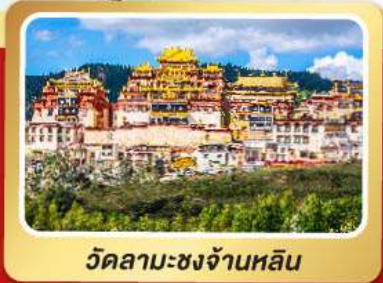
วัดลามะชงจ้านหลิ่ง