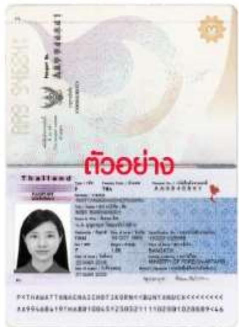
ตัวอย่าง สำเนาหน้าพาสปอร์ต หน้าเต็ม 2 หน้า

2. รูปถ่ายหน้าตรง รูปถ่ายสีชัดเจน ตามขนาดจริงสำหรับทำวีซ่า (ให้ชื่อไฟล์รูปถ่ายจากร้านถ่ายรูปเท่านั้น) และต้องถือรูปจริงในวันเดินทาง จำนวน 2 รูป