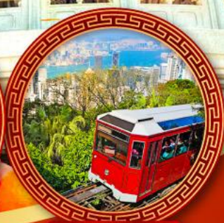
วัดตอเรียพิค+แถม รถรางนั่งขึ้นเขา ชมวิวเมืองสวยๆ