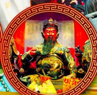
เทพเจ้ากวนอู ความซื่อสัตย์ ใจเมตตา อุดมปัญญา