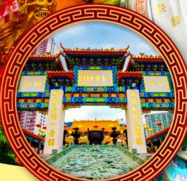
วัดหวังต้าเซียน ขอพรสุขภาพ ความรัก