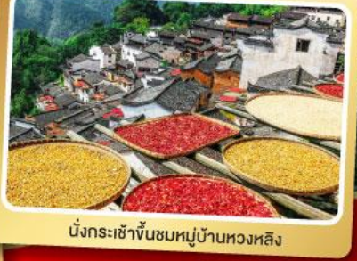
นั่งกระเช้าขึ้นชมหมู่บ้านหวงหลิง