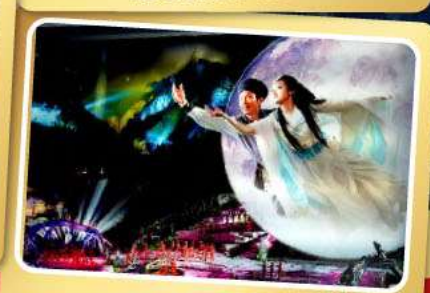
โชว์จิ้งจอกขาว