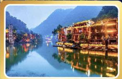
เมืองโบราณฟิ่งหวง

เที่ยวครบสูตร ฟู่หรง ฟิ่งหวง 6 วัน 5 คืน