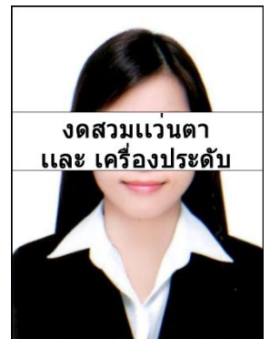
จดสวมแว่นตา และ เครื่องประดับ