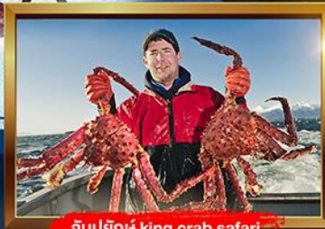
จับปูยักษ์ king crab safari

บินภายใน 2 ครั้ง รวมค่าวีซ่าเชงเก้น+ทิปคนขับรถ+ไกด์ท้องถิ่น