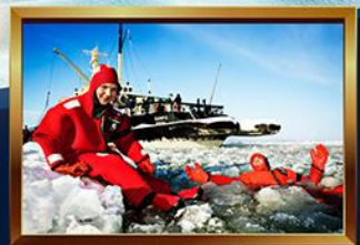
ล่องเรือคึกน้ำแข็ง SAMPO ICEBRAKER