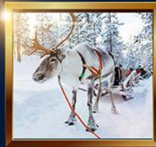
ทวางเรนเดียร์ ลากเลื่อน