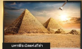
มหาพีระมิดแห่งกิซ่า