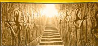
The Egyptian Museum