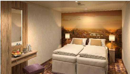
ห้องพักแบบไม่มีหน้าต่าง ขนาด 16 ตารางเมตร