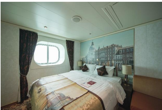
ห้องพักแบบมีหน้าต่าง ขนาด 18 ตารางเมตร