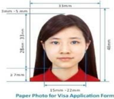
Paper Photo for Visa Application Form