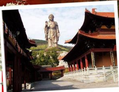
พระใหญ่หลังซานต้าฝอ