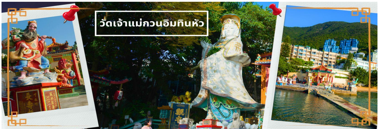
วัดเจ้าแม่กวนอิมทิ่นหัว

จากนั้นนำท่านเดินทางสู่ วัดเจ้าแม่กวนอิมทิ่นหัว อ่าวรีพลัสเบย์ (TIN HAU TEMPLE REPULSE BAY) ตั้งอยู่ริมทะเล เป็นสถานที่ท่องเที่ยวสำคัญ สร้างขึ้นในปี ค.ศ.1993 วัดแห่งนี้ถูกสร้างขึ้นเพื่อคุ้มครองชาวประมงในการออกเรือไปหาปลา ซึ่งเป็นหนึ่งในวัดที่เก่าแก่ที่สุดของฮ่องกง บริเวณวัดจะมี เจ้าแม่กวนอิมองค์ใหญ่ ประสงค์ประทานพรตั้งอยู่เป็นเทพที่ชาวฮ่องกงและคนจีนให้ความเคารพนับถือมากที่สุด สามารถขอพรได้ทุกเรื่อง วัดนี้เป็นที่นิยมมีนักท่องเที่ยวเดินทางมาขอพรกันมากมาย เพราะเชื่อในความศักดิ์สิทธิ์ และยังมีเจ้าแม่ทับทิม หรือเทพธิดาแห่งท้องทะเลองค์ใหญ่ ซึ่งคนฮ่องกง คนมาเก๊า และคนจีน ที่อยู่ริมทะเล ชาวประมง นักเดินเรือหรือผู้ที่เดินทางทางเรือเป็นประจำ จะนับถือ