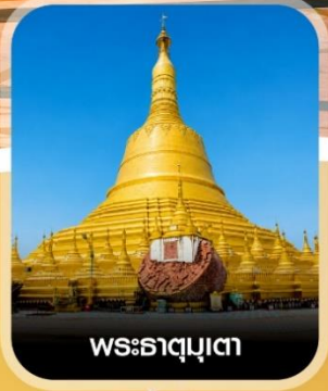
พระธาตุมุเตา