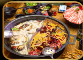
พิเศษ! เมนูหม้อไฟ สุกี้ หม้อไฟสไตล์จีน