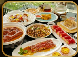
อาหารระดับ มิชลิน TAO TAO JU