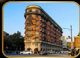
ถ่ายรูปจุดเช็คอิน WUKANG MANSION