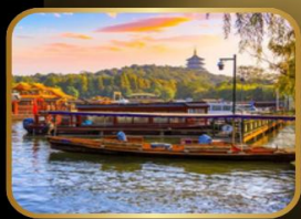
ล่องเรือ ทะเลสาบซีหู