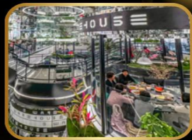
ภัตตาคารชื่อดัง WAREHOUSE NO.3