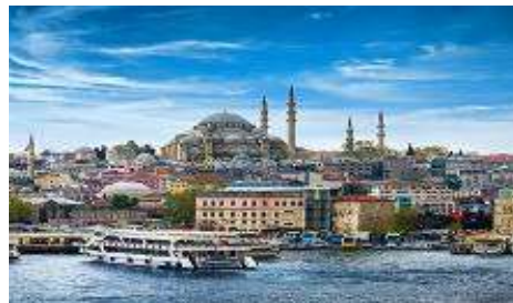
ล่องเรือช่องแคบบอสฟอรัส