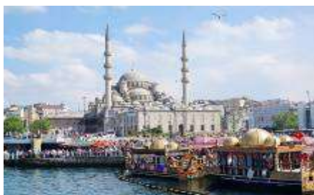
เมืองอิสตันบูล