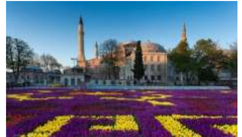
เทศกาลทิวลิป ณ กรุงอิสตันบูล