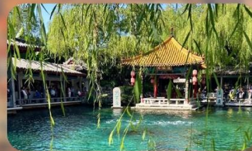
พิพิธภัณฑ์เบียร์ซิงเต่า