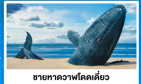
ชายหาดวาฬโดดเดี่ยว