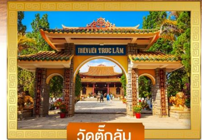
วัดดักลิ้ม