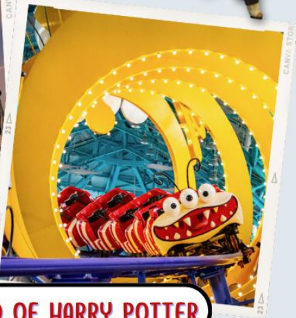
KUNG FU PANDA LAND OF AWESOMENESS