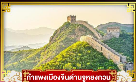
กำแพงเมืองจีนค่านูหยงกวน