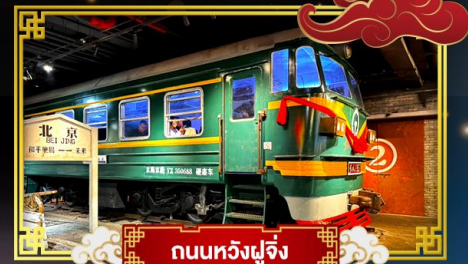
ถนนหัวงฝูจิ่ง