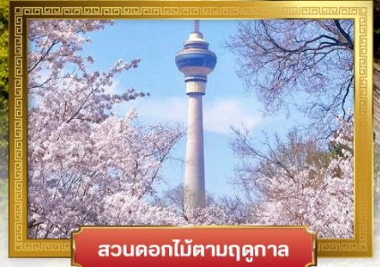
สวนดอกไม้ตามฤดูกาล