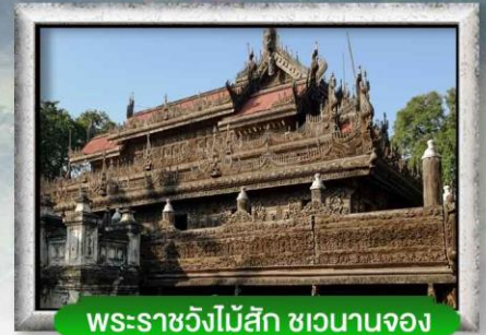
พระราชวังไม้สัก ซอนานจง