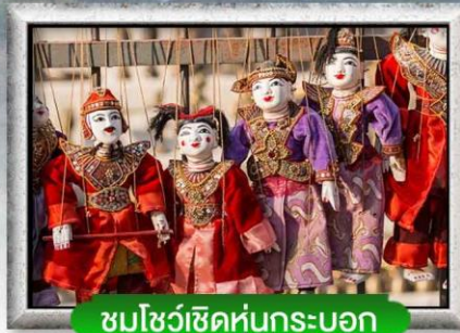
ชมโชว์เชิดหุ่นกระบอก