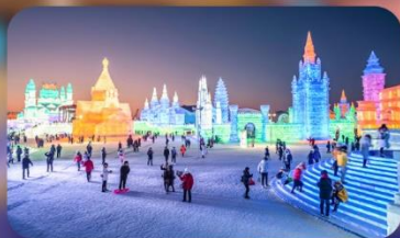
เทศกาลน้ำแข็งฮาร์บิน