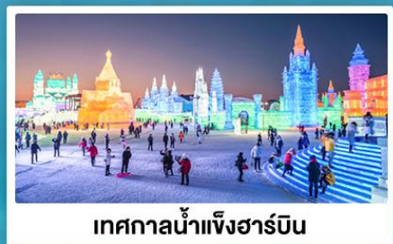
เทศกาลน้ำแข็งฮาร์บิน