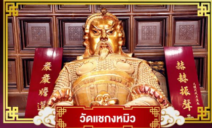
วัดเขกงทมิว