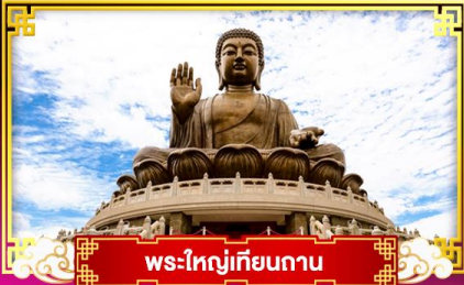
พระใหญ่เทียนกาน

เที่ยว..สวนสนุกดิสนีย์แลนด์ นั่งรถรางพิกแตรม ขึ้นกระเช้าองปิง 360 องศา