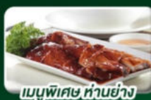
เมนูพิเศษ ห่านย่าง