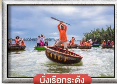
นั่งเรือกระดิง