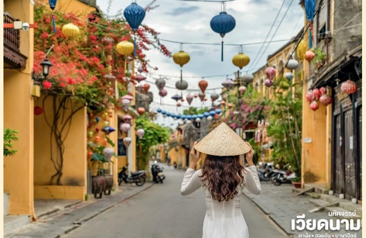
บหคจรรย เวียดนาม ดานัง • ฮอยอัน • บานาฮิลล์