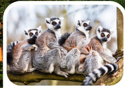
เลมูร์สัตว์ประจำเกาะมาดากัสการ์