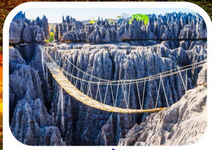
อุทยานแห่งชาติซิงกี เดอ เบอมาราฮา