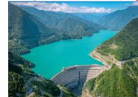
เซ็อนเอนกูรี