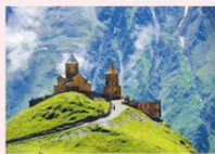
Gergeti sameba church

** พักที่ Intourist Kazbegi Hotel หรือเทียบเท่า **