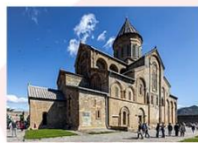
วิหารสเวตสโคเวลี