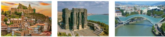
เมืองทбилиซี CHRONICLE OF GEORGIA สะพานสันติภาพ

05.20 น. เดินทางถึงสนามบินอิสตันบูล และเปลี่ยนเครื่อง 06.55 น. ออกเดินทางสู่สนามบินทбилиซี เที่ยวบิน TK378 09.45 น. เดินทางถึงสนามบินทбилиซี ประเทศจอร์เจีย