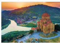
อารามจวารี