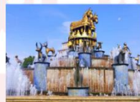
เมืองคูไทซี

** พักที่ Kutaisi Inn Hotel หรือเทียบเท่า **