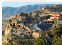
เมืองอุพลิสซิคะ