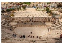
โรงละครโรมัน