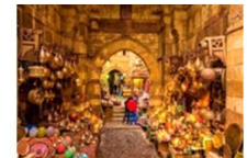
ตลาดซ่านเอลคาลีลี

19.50 น. เดินทางสู่ทำอากาศยาน QUEEN ALIA ประเทศจอร์แดน เที่ยวบินที่ RJ 506