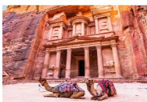
เมืองเพตรา