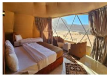
นอนแคมป์ Bubble Dome

** พักที่ Luxury Wadi Rum Magic Bubble Dome 4* หรือเทียบเท่า **