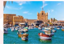
เมืองอเล็กซานเดรีย