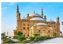
ป้อมปราการแห่งไคโร