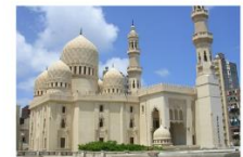
Abu Al-Abbas Al-Mursi