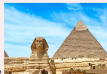
มหาพีระมิดกิซา, สฟิงซ์