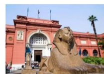
The Egyptian Museum

** พักที่ Saray Pyramids & Museum View Hotel 4* หรือเทียบเท่า **