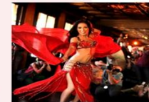
ชมรับประทานอาหาร

** พักที่ Saray Pyramids & Museum View Hotel 4* หรือเทียบเท่า **