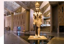
Grand Egyptian Museum